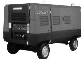
SADRO8P オイルフリーコンプレッサー