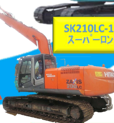
ZX200LC-5クレーン スーパーロング18m