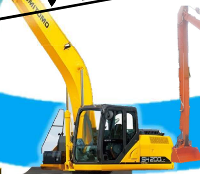
SH200LC-7クレーン スーパーロング15m