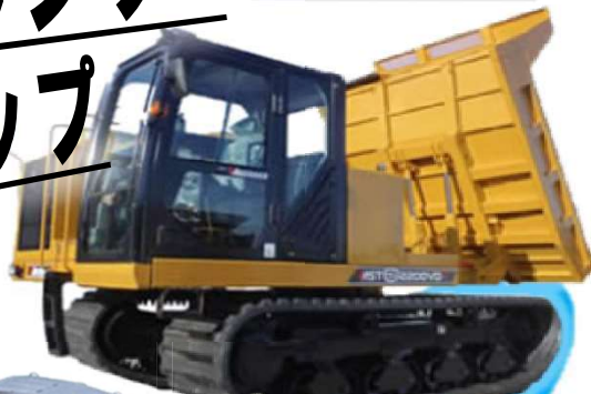
MST-2200VDR 全旋回 11t