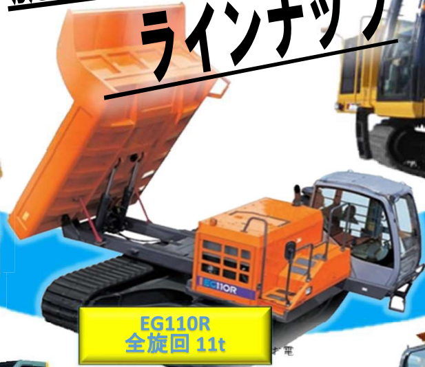
EG110R 全旋回 11t