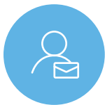
One to One コンテンツ