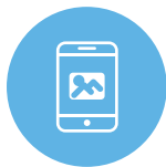
フローティング 広告