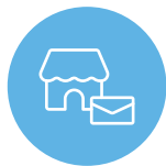
店舗別 コンテンツ配信