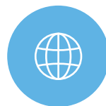
アプリ内ブラウザ