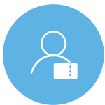
One to One クーポン