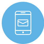
アプリ内メッセージ