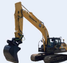
SH200-7MC チルトローテータ