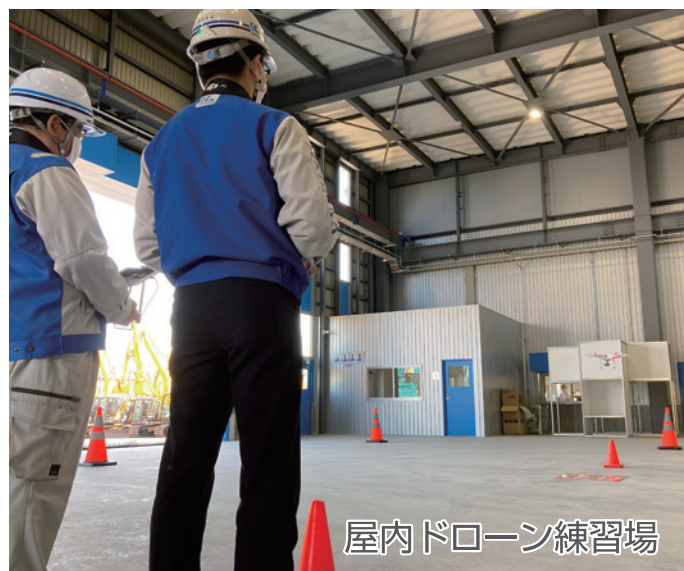
屋内ドローン練習場