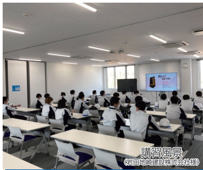
講習風景 (岩田地崎建設株式会社様)